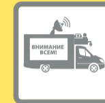
ПОДВИЖНЫЕ ЗВУКОУСИЛИТЕЛЬНЫЕ УСТАНОВКИ